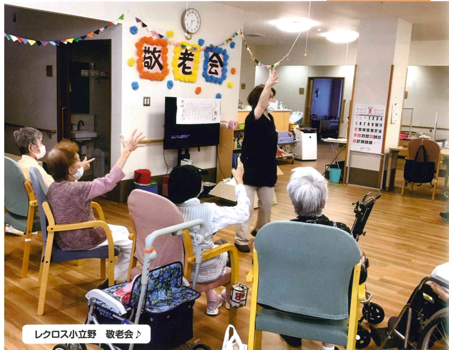
レクロス小立野 敬老会♪